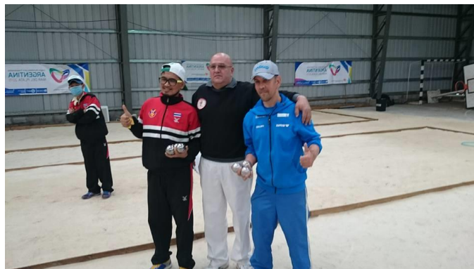
MM-2015 Mar Del Plata MM-pronssimitali

2016- Pari petanquen EM-hopeamitali Vantaa. Suomi 2016- Henkilökohtainen petanquen EM-hopeamitali Vantaa- Suomi 2015- Henkilökohtainen petanquen MM- pronssimitali Argentiina Mar Del Plata 2014- Pari petanquen EM-hopeamitali Puola Krakova 2010- Henkilökohtainen petanquen EM-kultamitali Irlanti Dublin 2010- Pari petanquen EM- pronssimitali Irlanti Dublin